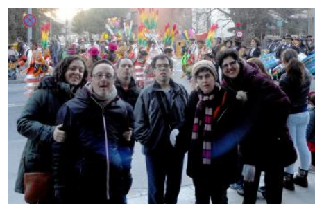
A punt per sopar