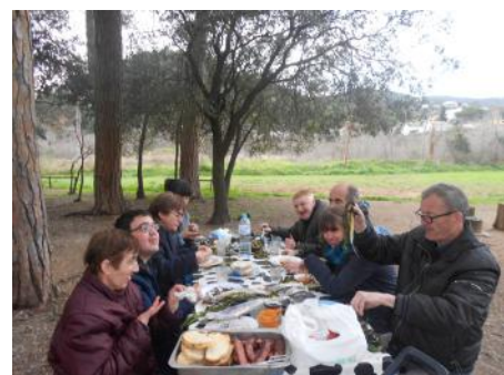
Degustant una gran calçotada!