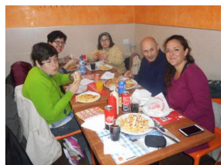
A la Hamburguesa Gigante