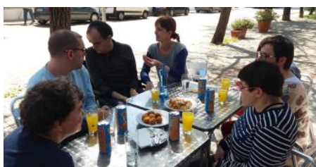
Prenent un refresc