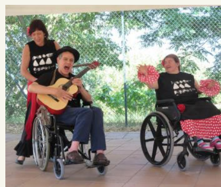
"Sarandonga" actuació molt divertida