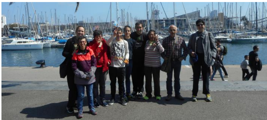
Museu d'història de Catalunya