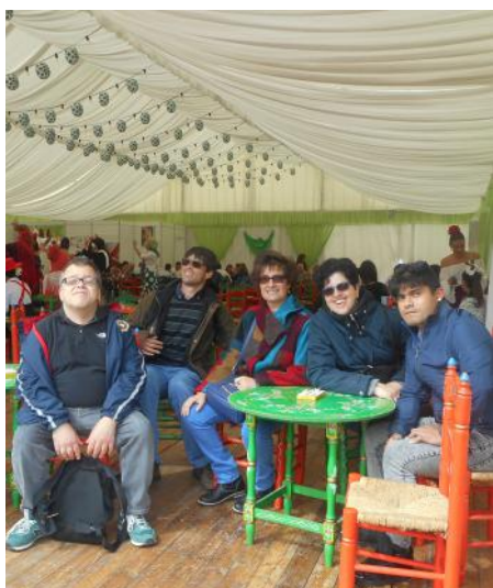
Feria de Abril