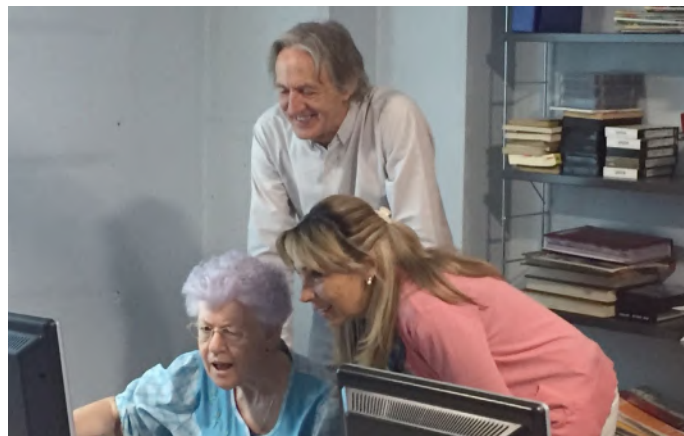
Mostrem com dominem les noves tecnologies als nostres familiars

menú; i després, ens hem dirigit a la sala de TICS per fer dinàmiques grupals amb la PDI amb diverses activitats interactives. Fins i tot els pares han participat i, hi ha hagut algun duel amb els jocs de memòria!