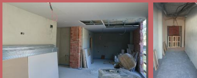
Diverses imatges de l'evolució de les obres a l'interior de la nova llar