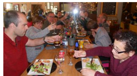
Al Gato Verde