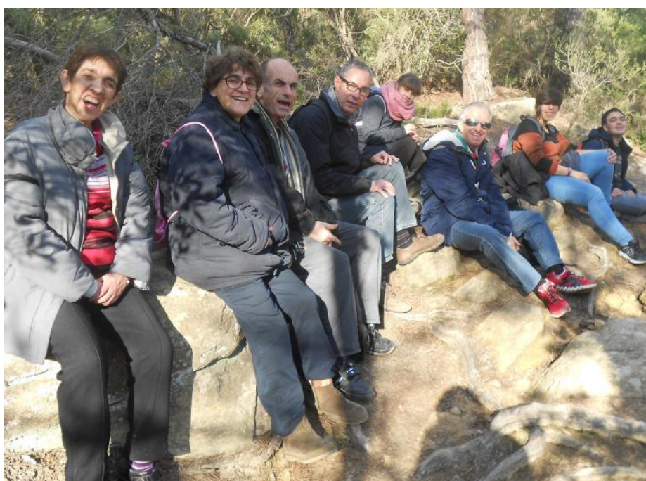
Fent gana per la calçotada