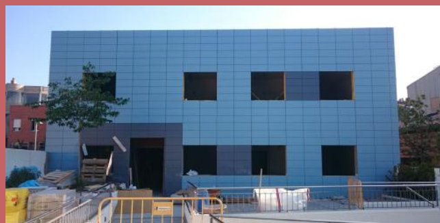
La façana de la nova llar

En els darrers números de la revista Batec us hem anat informant, recollint també el procés en imatges, sobre l'evolució del procés per a la construcció del segon edifici d'aquest conjunt de llar residències ja està en marxa i les obres continuen a bon ritme. En aquest número, a banda de mostrar-vos la façana de l'edifici, també ens fa molta il·lusió compartir amb vosaltres l'evolució de la construcció de l'interior de l'edifici.