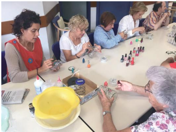
Familiars, professionals i persones ateses compartint l’activitat de reciclatge

• Rialles, gratitud, confiança, orgull, interès són només algunes bones emocions que s’han viscut avui durant la festa de les famílies que ha tingut lloc en algunes Sales del Centre Ocupacional. Concretament en la sala 2, s’ha començat fent una petita presentació entre professionals d’atenció directa i famílies, fent explicació dels itineraris individuals i realitzant jocs cognitius amb l’ajuda dels convidats. Hem acabat la sessió gaudint d’un bingo format per imatges. Un joc que ha facilitat la interacció i cohesió entre membres familiars, professionals i usuaris. Ens ho hem passat d’allò més bé exclamant, BINGO!