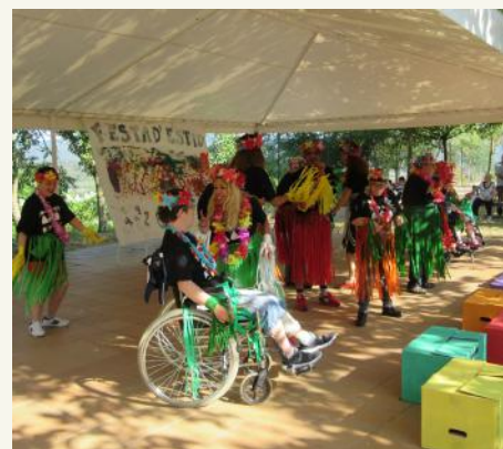
Moment del ball hawaïà amb la cançó de "Me enamore" de Shakira