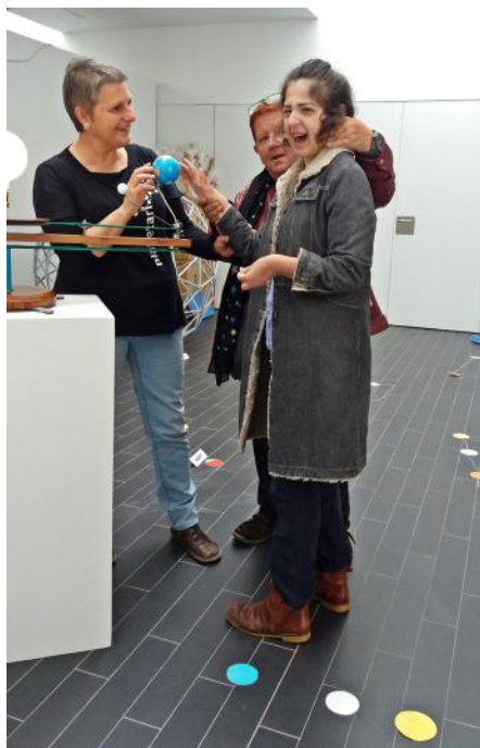
"Fem astronomia" de l'Associació Cultural