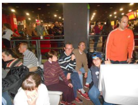
A la bolera