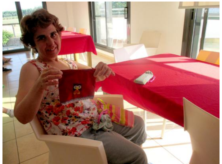
La Judith Canton ens mostra satisfeta una bosseta feta per ella mateixa